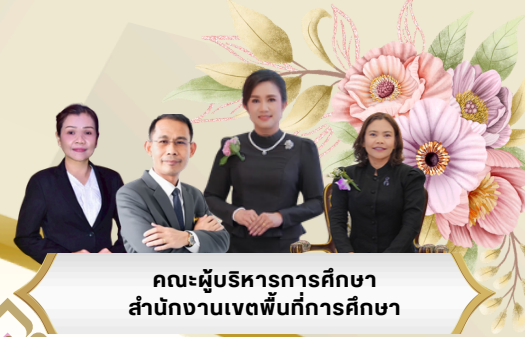
คณะผู้บริหารการศึกษา สำนักงานเขตพื้นที่การศึกษา