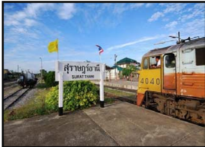
สถานีรถไฟจังหวัดสุราษฎร์ธานี

๒) ท่าอากาศยานเอกชนนานาชาติเกาะสมุย มีสายการบินบางกอกแอร์เวย์และการบินไทย ให้บริการบินไป-กลับ เกาะสมุย-กรุงเทพฯ กัวลาลัมเปอร์ สิงคโปร์ ฮองกง ปีนัง พัตยา ภูเก็ต และกระบี่