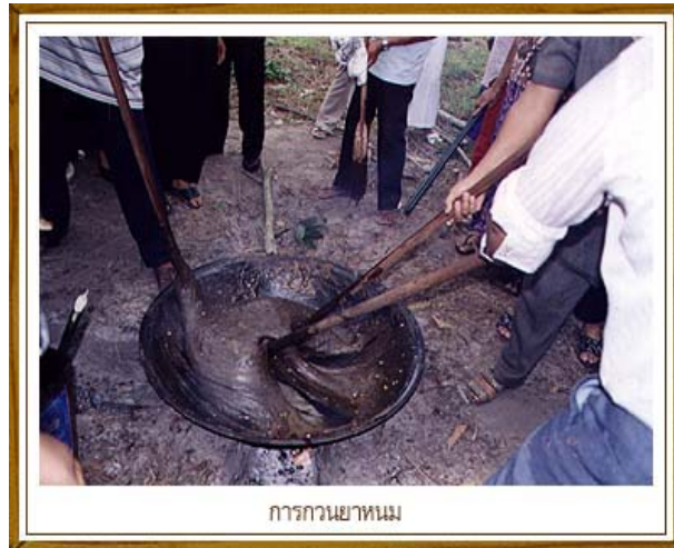
การกวนยาหนม

เป็นขนมชนิดหนึ่งที่นิยมทำในจังหวัดสุราษฎร์ธานี ซึ่งนิยมทำในงาน เช่น งานแต่งงาน งานบวชนาค ฯลฯ งานใดๆ เลี้ยงยาหนม ถือว่าเป็นงานใหญ่มาก เพราะการกวนยาหนมต้องใช้คนจำนวนมาก ยาหนมจึงมีศักดิ์ศรีสูงกว่า ขนมประเภทอื่นๆ เหตุผลที่เรียกว่า ยาหนม ผู้รู้ในสมัยก่อนให้เหตุผลว่า คำว่า ยาหนม นำมาจากชื่อเต็มว่า พระยาหนม หรือพญาขนม ซึ่งหมายถึง ยอดแห่งขนม หรือ เจ้าแห่งขนมทั้งหลาย แต่ชาวใต้นิยมเรียกสั้น จึงตัดคำว่า พระ ออกเหลือแต่ ยาหนม ส่วนผสมในการทำ ได้แก่ แป้งข้าวเหนียว น้ำตาลปีบ น้ำกะทิสด ซึ่งคั้นจากมะพร้าว หรือมะพร้าวที่ขูดแล้ว