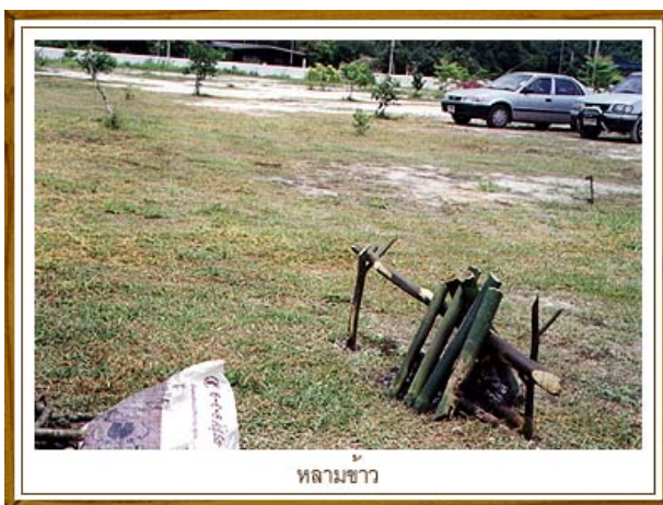
หลามข้าว

ข้าวหลาม เป็นข้าวเจ้าที่ทำให้สุก โดยเอาข้าวสารห่อใบไม้ใส่กระบอกลงแล้วเผาไฟให้สุก ส่วนผสม ข้าวสารเจ้า ใบเร็ด น้ำ โดยการนำ ข้าวสารมาล้างให้สะอาด แล้วห่อด้วยใบเร็ด (ทำให้ข้าวหลามหอมน่ารับประทาน) ห่อแบบข้าวต้มมัด แต่ไม่ต้องผูกเชือก นำข้าวสารที่ห่อ ไปใส่ในกระบอกลงไม้ไฟ ใส่น้ำให้ท่วม แล้วเอาไปย่างไฟให้สุก รับประทานเป็นอาหารหลักได้