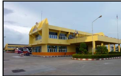
สถานีขนส่งจังหวัดสุราษฎร์ธานี