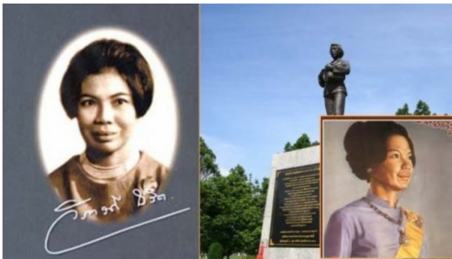
พระประวดี

พระเจ้าวรวงศ์เธอ พระองค์เจ้าวิภาวดีรังสิต มี