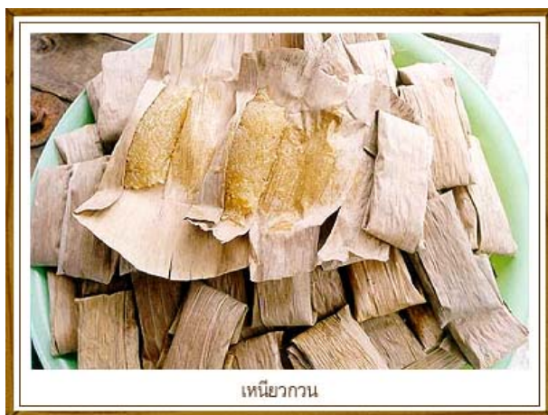
เหนียวกวน

"เหนียวกวน" หรือ "ข้าวเหนียวกวน" เป็นขนมที่นิยมทำรับประทานกันในครัวเรือน หรือ ฝากญาติมิตรกันมาก ของชาวอำเภอไชยา เครื่องปรุง มีข้าวเหนียวหนึ่ง มะพร้าวขูด (ต้องไม่แก่จัด) น้ำผึ้ง (น้ำตาลโตนดที่เคี้ยวยังไม่แข็ง) หอมซอย การปรุงเริ่มด้วยนำข้าวเหนียวขาวไปแช่น้ำประมาณ๓ ชั่วโมง นำไปนึ่งให้สุก เทข้าวเหนียวที่นึ่งแล้วใส่ ถาดผึ่งให้หมาด ๆ นำน้ำตาลที่เคี้ยวพอเป็นน้ำผึ้งมาตั้งไฟให้เดือด (ควรใช้กระทะทอง-เหลือง) ใส่ข้าวเหนียวกวนให้เข้ากัน แล้วใส่มะพร้าวขูด หอมซอย กวนไปเรื่อยๆ จนแห้ง แต่ไม่ให้แข็งเกินไป ยกกลงอีกเล็กน้อย นำไปห่อด้วยใบตองแห้งขนาดพอควร (ใช้ใบตองกล้วยตานีที่แห้งนำมาฉีก เจียนหัวท้ายให้เรียบร้อยเช็ดให้สะอาดแล้วนำไปห่อ)